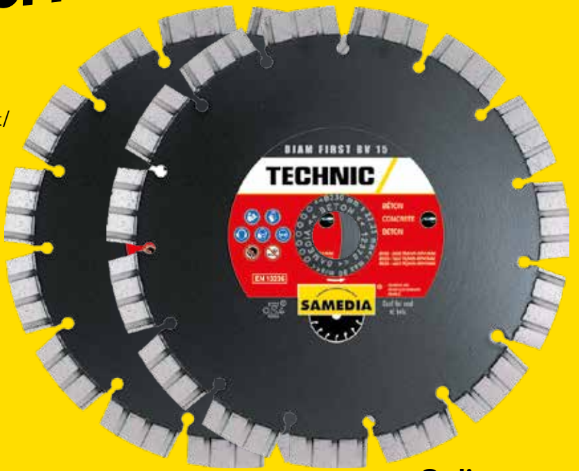
2 disques Ø 230 mm